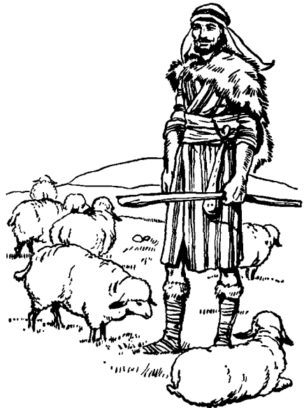
Ngéngonmbatg ki batg lon.

22 I dönah kult, i kaglo ra fête ki töa i *Fête Kar kuj ndub Luḅah kam bébo Jérusalem. 23 Jésus a ndia kam kuj ndub Luḅah, gir bulot lo Salomon, 24 Kitö inñen Juifg lan'na gugin döa, ndijèna annan: «Mbañ ki ndö ri a i nyaji ki kam ki ra bississ a? Inla i Christ a nè, el i jaji rau!» 25 Jésus turdi an: «M'elsi woi, na adin rota al. Killäg ki m'ndi m'ra kam tö Bobmt inñ la ndi mammin naj yé. 26 Na adin rota